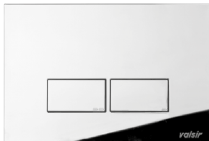
ABS cromo lucido